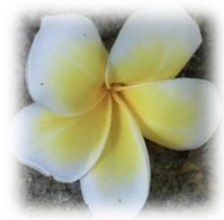
Preservation Divisionの 建物横の木から落ちた花

http://www.nlv.gov.vn/ Preservation Division http://nlv.gov.vn/ef/en/preservation-division.html