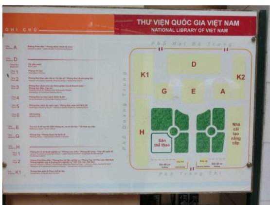
K1 の建物が Preservation Division