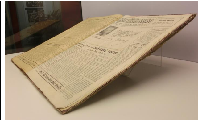
表紙が付けられた新聞