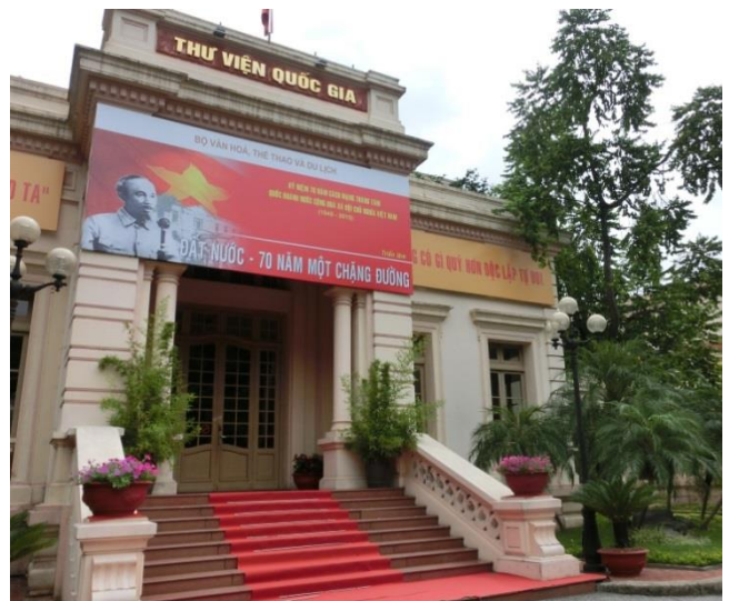
1945年の独立から70年。(独立記念日9月2日)