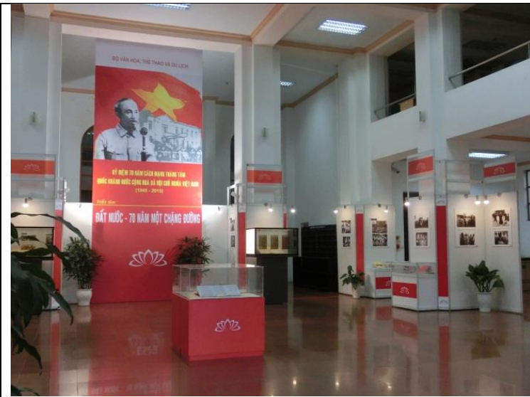
1945年の独立から70年（独立記念日9月2日）。ロビーでは関連展示。