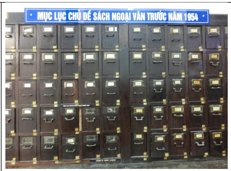
木製カードケース。1954年は、ディエンビエンフーの戦いでベトナム独立同盟がフランス軍を破った年(但し、その後、南北に分断されてしまう)。