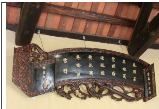
掲げたあった額。本の箱？